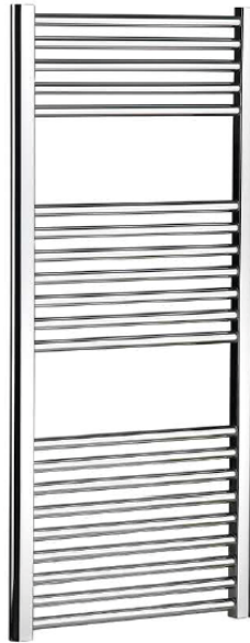
IMMAGINE PRODOTTO / PRODUCT IMAGE