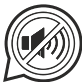
RIDOTTO IMPATTO ACUSTICO